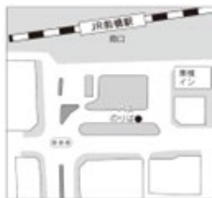
前橋駅北口6のりば